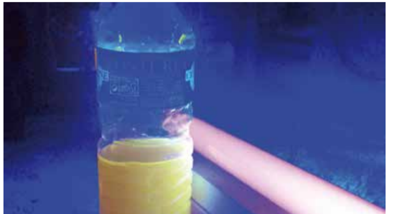
Sous le soleil B50, 2015 © Mathilde Barrio Nuevo

Entre rituel de sorcellerie et laboratoire clandestin destiné à des fins douteuses, l'exposition Sous le soleil B50 se développe comme un rébus où l'histoire, s'il y en a une, est à reconstituer d'indice en indice. Passant de sculptures en installations, on est immergé dans la quasi-obscurité du lieu d'exposition : théâtre d'un événement mystique.