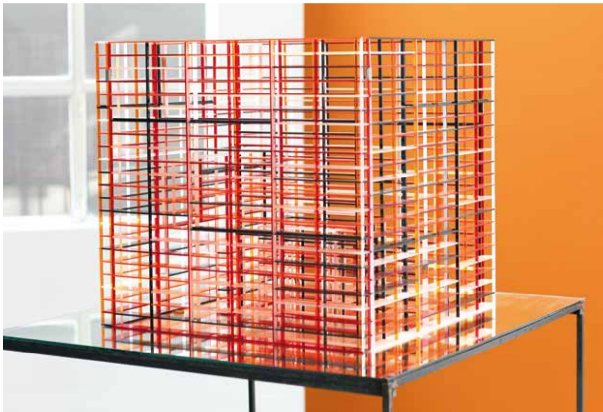
The James Joyce Monument, 2012 Plexiglas, métal, miroir - 140 × 80 × 75 cm