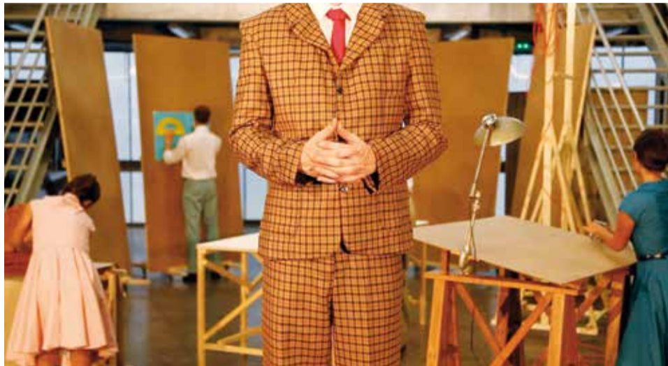
La vie héroïque de B.S. Acte II – Le dilemme de l'œuf, 2015, © Hoël Duret

Les notions de production et de construction sont centrales dans le travail d'Hoël Duret. Ce qui l'intéresse dans ces processus n'est pas tant les esthétiques qu'ils véhiculent mais bien de trouver, montrer et démontrer les mécanismes et idéologies qui les animent en évacuant toute fascination pour les formes du moderne. Au contraire, c'est dans le jeu critique qu'il s'en saisit, les ausculte, les amende, les bouscule, au risque de les mettre en danger. On pourrait voir, en somme, son travail comme un lieu de test de la résistance de ces formes. Pour son exposition personnelle au Musée des Beaux-Arts de Mulhouse, l'artiste projette pour la première fois ses obsessions dans le champ fictionnel et se lance dans l'écriture et la création d'un opéra en trois actes. La vie héroïque de B.S. - Un opéra en trois actes, 2013-2015 est un récit épique qui met en scène l'histoire de B.S., mystérieux designer dont les certitudes héritées de la pensée moderniste le confinent à l'absurde et au désenchantement.