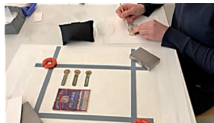
Abb. 12 Montierung einiger vollstndig erhaltener Etiketten und Banderolen. Foto: Ute Woracek, 2021