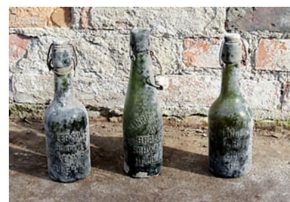
Abb. 5 Geprägte Glasflaschen.

Vier Getränkeetiketten – darunter zwei Varianten eines Motivs – wurden in der MusterFabrik Berlin 3 digital rekonstruiert (Abb. 7–9). Damit können drei Getränkesorten der Brauerei benannt werden: das Pelikan-Malzbiere (Abb. 7), eine alkoholfreie Himbeerbrause (Abb. 8) und ein Pilsner, das zunächst Pelikan-Pilsner und, vermutlich nach Umbenennung der Brauerei, Schwemme-Pilsner