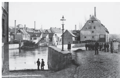
Abb. 1 Gebäudeansicht (historisch).

Der Schwemme e.V. verfügt über eine umfangreiche Sammlung historischer Bierflaschen. Zugehörige Etiketten aber fehlten lange Zeit vollständig. Aus diesem Grund sind die 2019 entdeckten Fragmente historischer Getränkeetiketten als Quelle für die Erforschung der Haus- und Brauereigeschichte sowie der regionalen Industriegeschichte außerordentlich wertvoll.