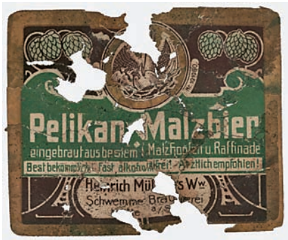
Abb. 7 Rekonstruiertes Etikett, Motiv: Pelikan-Malzbier.