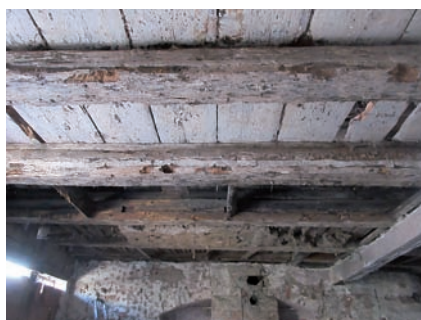
Abb. 4 Fundstelle: Unteransicht der Dielung (Ansicht vom Erdgeschoss).