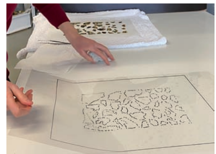
Abb. 11 Vorbereitung fr die Kaschierung von Fragmenten. Foto: Irene Bruckle, 2021