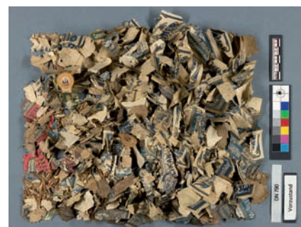
Abb. 6 Fragmentierte Getränkeetiketten im geborgenen Zustand.