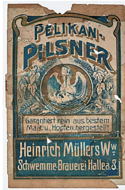
Abb. 9a Rekonstruiertes Etikett, Motiv: PILSNER Variante PELIKAN.