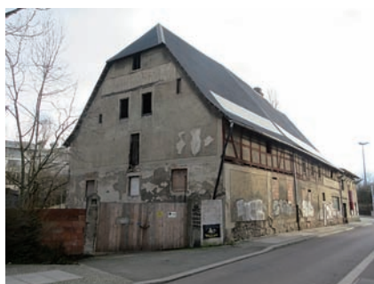
Abb. 2 Gebäudeansicht (aktuell). Foto: Henryk Löhr, 2018