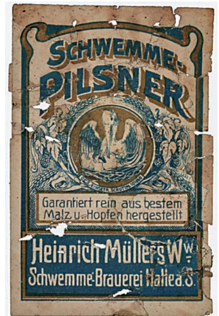
Abb. 9b Rekonstruiertes Etikett, Motiv: PILSNER Variante SCHWEMME.

hie (Abb. 9). Hopfendolden, Gerstenähren und der Pelikan illustrieren die Etiketten. Zwei weitere Getrnke (CAMEL MALZ-BIER PELIKAN und Brauselimonade CITRONE) konnten anhand vollstndig erhaltener Etiketten ermittelt werden (Abb. 14).