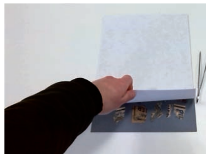
Abb. 10 Tableau aus Wellpappe (dunkelgrau) mit Fragmenten; Filterpaper wird aufgelegt.