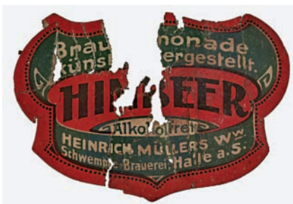
Abb. 8 Rekonstruiertes Etikett, Motiv: Brauselimonade HIMBEER. Foto: MusterFabrik Berlin, 2020