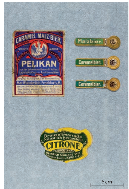
Abb. 14 Paneel montierter Etiketten. Foto: Philine Schneider, 2021