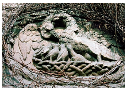
Abb. 3 Wandrelief am Südgiebel. Foto: Detlef Wulf, 1995